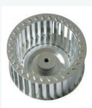
无火花离心式风叶